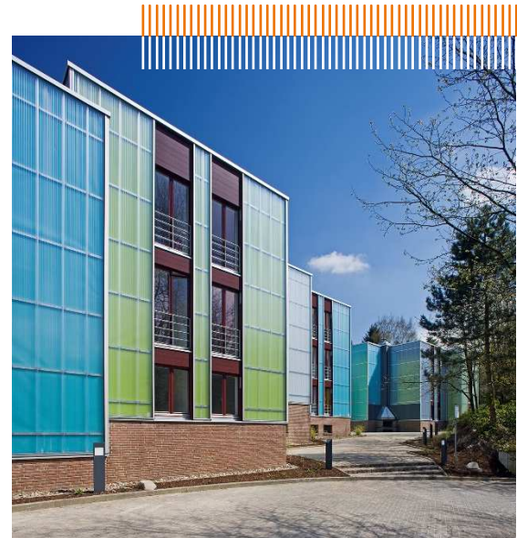
Bild 2: Nach umfangreichen Dämmarbeiten im Zuge der Modernisierung 2008 erreicht das 1984 gebaute Gebäude an der Max-Horkheimer-Straße Niedrigenergiehausstandard.